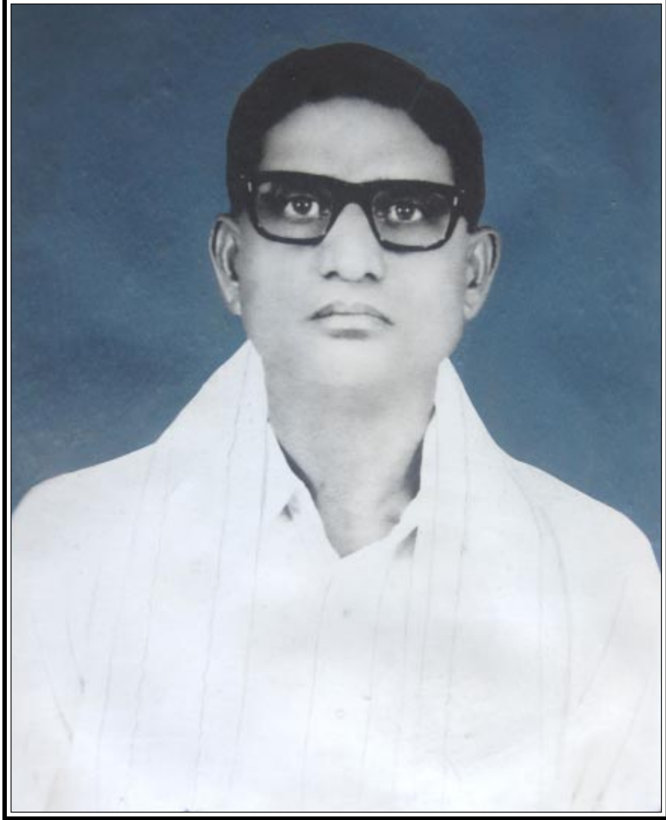
రచయిత: త్రిపురనేని విష్ణుశంకరరావు