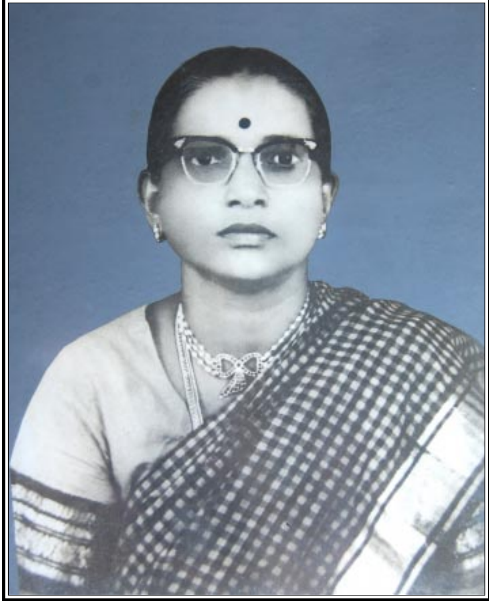
పీఠ ధర్మపత్ని: త్రిపురనేని ధనలక్ష్మి